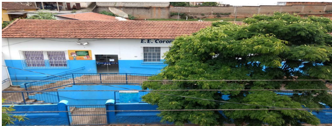
Fotografia 1 – Escola Estadual Coronel José Custódio (2018)

Fui gestada e nasci, de alma e coração, na Escola Estadual Coronel José Custódio 3 , onde estudei e lecionei por aproximadamente 25 anos. Tempo de crescimento, de gestão de aprendizagem, de luta e de construção profissional.