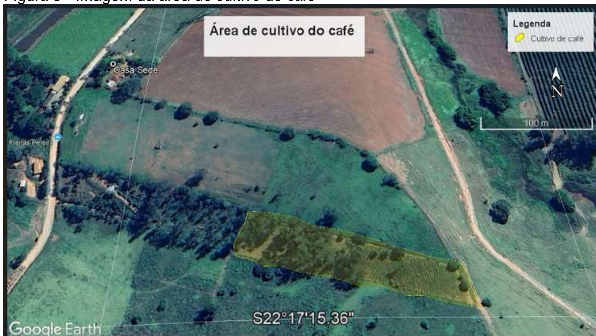
Figura 3 - Imagem da área do cultivo de café