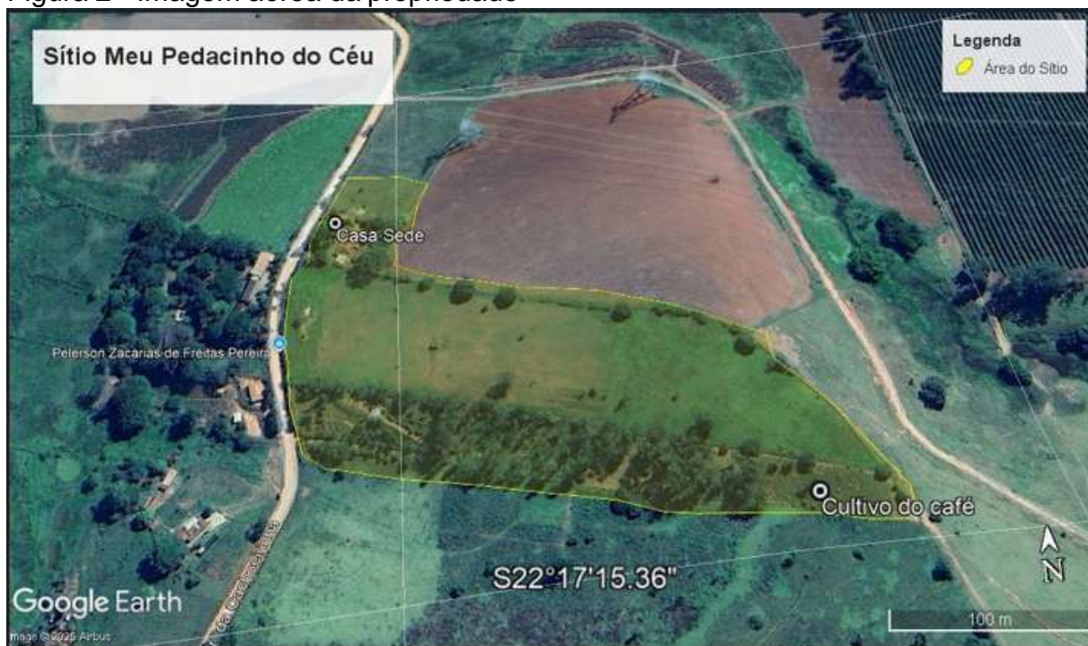
Figura 2 - Imagem aérea da propriedade