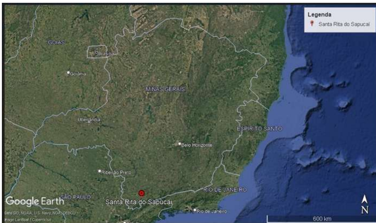
Figura 1 – Localização do município cede da propriedade estudada

A pesquisa foi realizada no sítio Meu Pedacinho de Chão, localizado no município de Santa Rita do Sapucaí, no sul de Minas Gerais, numa altitude de 885m, latitude 22^{\circ}17'15''\text{S} e longitude 45^{\circ}42'01''\text{W} . O município apresenta precipitação pluvial anual média de 107,1mm distribuídas de outubro a abril, temperatura anual que varia de 6^{\circ}\text{C} à 34^{\circ}\text{C} e clima caracterizado como mesotérmico brando tipo Cwb - Clima subtropical de altitude, com inverno seco e verão ameno tropical de altitude (WEATHER SPARK, 2024).