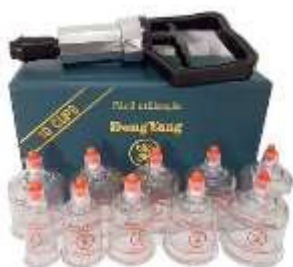
Fotografia 1- Ventosa de acrílico