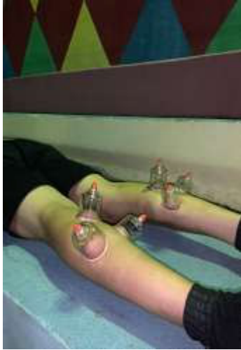
Fotografia 2- Intervenção com ventosa estática