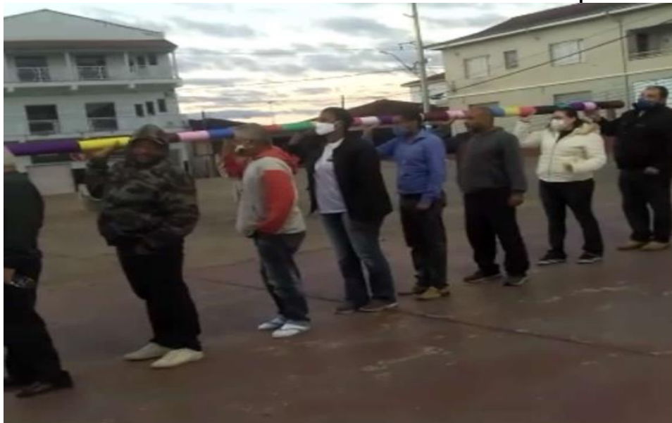
Figura 3 - Levantamento do Mastro de São Benedito em formato adaptado em 2020 4

Para cumprir a promessa sem violar a segurança, o ato máximo do rito precisou de uma adaptação histórica. A Subida do Mastro e da Bandeira, tradicionalmente realizada ao final da tarde, foi antecipada drasticamente para as 6 horas da manhã, um movimento estratégico para evitar aglomerações. O Mastro foi levantado discretamente, nas primeiras horas do dia. Mesmo sem anúncio, a informação correu rápido na cidade pequena, e alguns devotos se reuniram em um ato espontâneo de fé que reafirmava o ciclo da vida, apesar do medo.