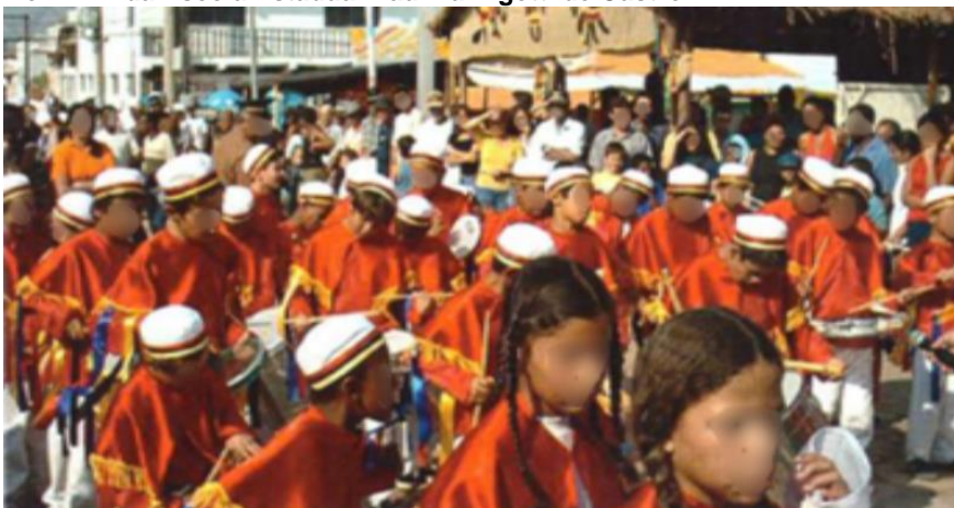
Figura 32 – Terno Mirim da Escola Estadual Paulina Rigotti de Castro.