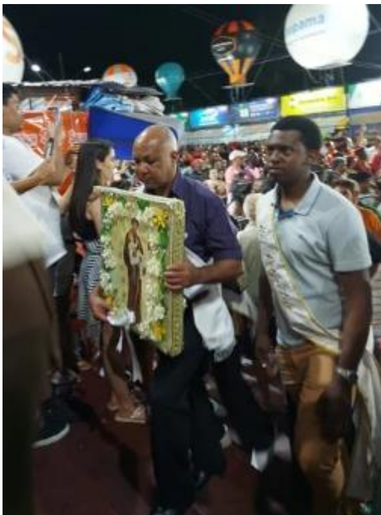
Figura 26 – Capitão da Bandeira de São Benedito acompanhado pelo Rei Perpétuo no último dia da festa.