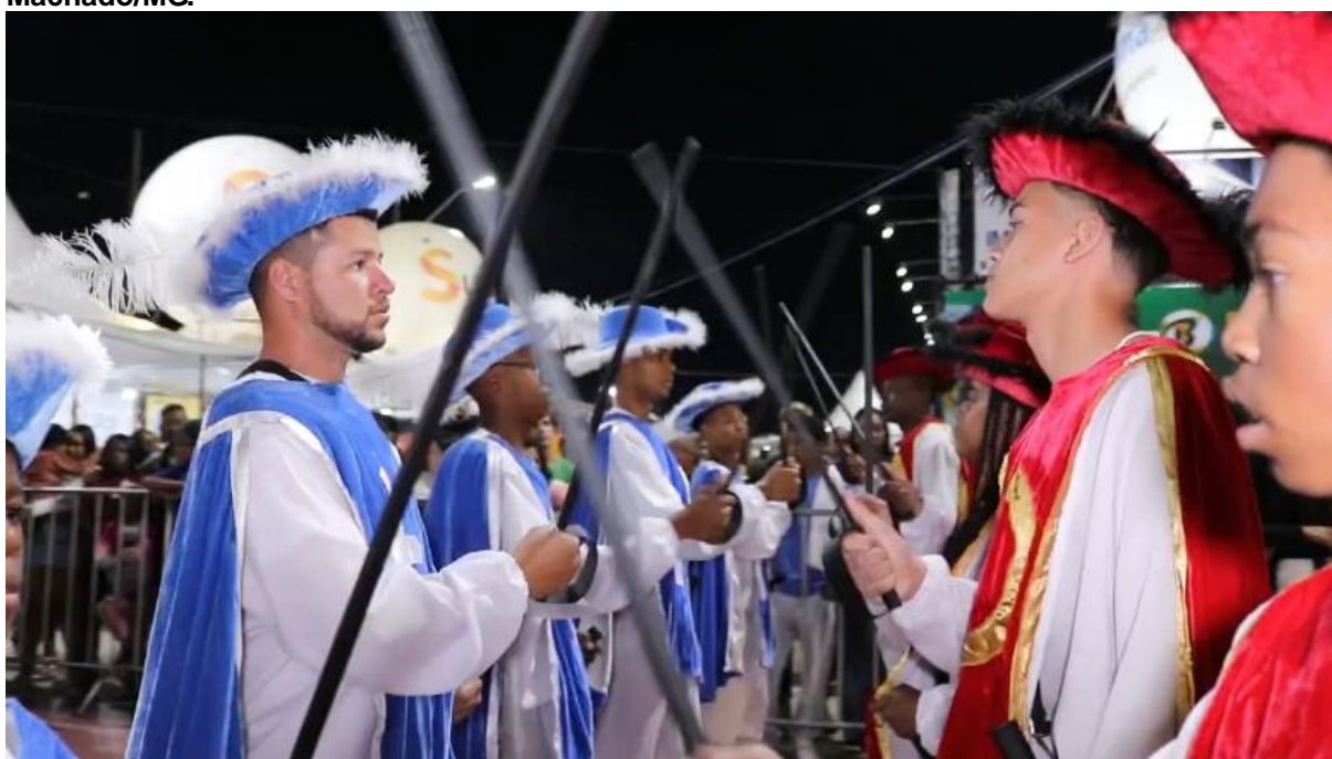
Figura 10 – Encenação da Embaixada de Carlos Magno durante a Festa de São Benedito de Machado/MG. 8

Uma bandeira vermelha Avistei em alto mar E o navio de guerra Acabou de apitar (Tradição Oral)