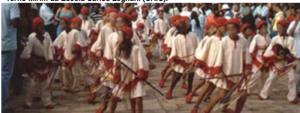
Figura 36 – Terno Mirim da Escola Carlos Legnani (CAIC).