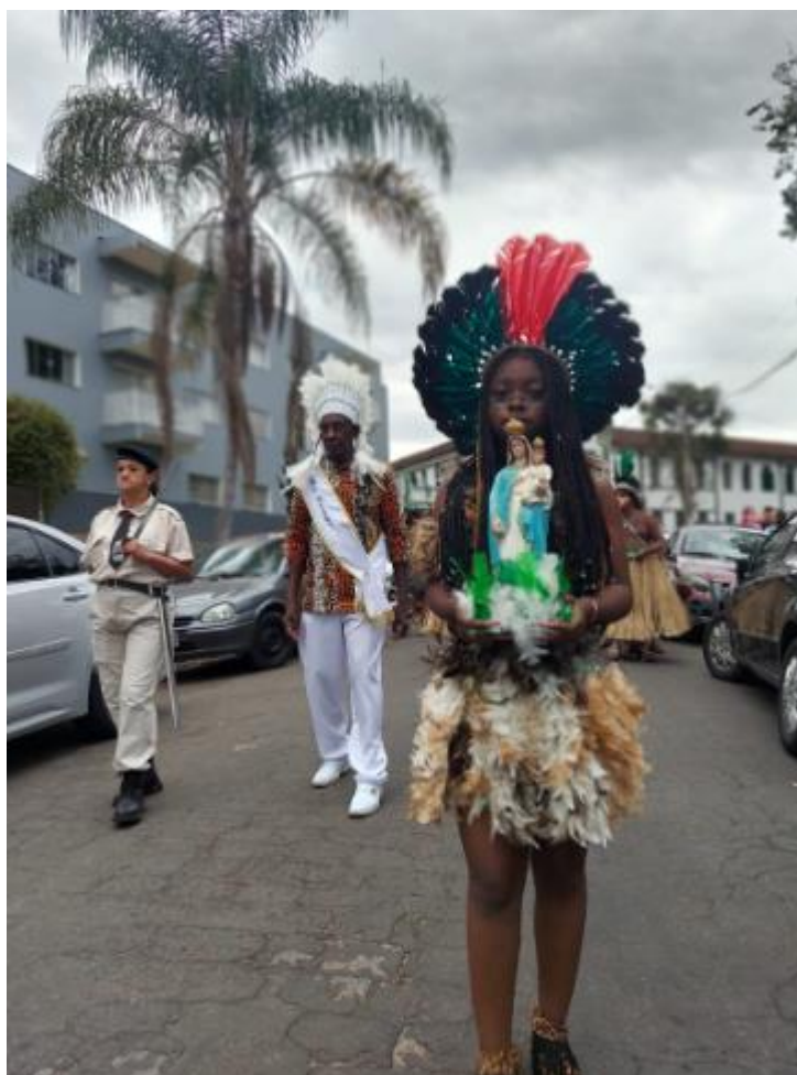
Figura 19 – Retirada dos Caiapós.

Fonte: Arquivo Público Municipal De Machado (Acervo Daniel Serafini Alves), 2024.