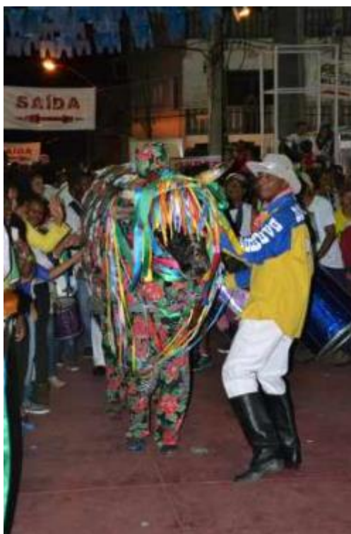
Figura 16 – Bumba-meu-boi.

Ambos os ternos são presenças marcantes e indispensáveis na Festa de São Benedito, reforçando o caráter popular e cultural da celebração, que une devoção, música, dança e memória em torno das tradições machadenses.