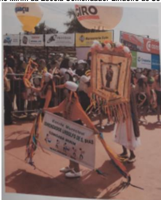
Figura 34 – Apresentação do Terno Mirim da Escola Comendador Lindolfo de Souza Dias.