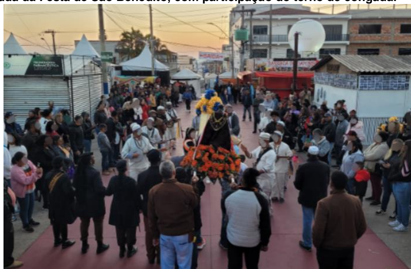
Figura 5 – Alvorada da Festa de São Benedito, com participação do terno de congada.