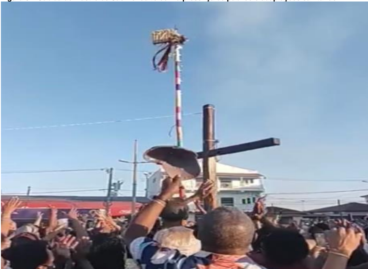
Figura 3 – Subida do Mastro de São Benedito com a presença de público e adaptações sanitárias. 7