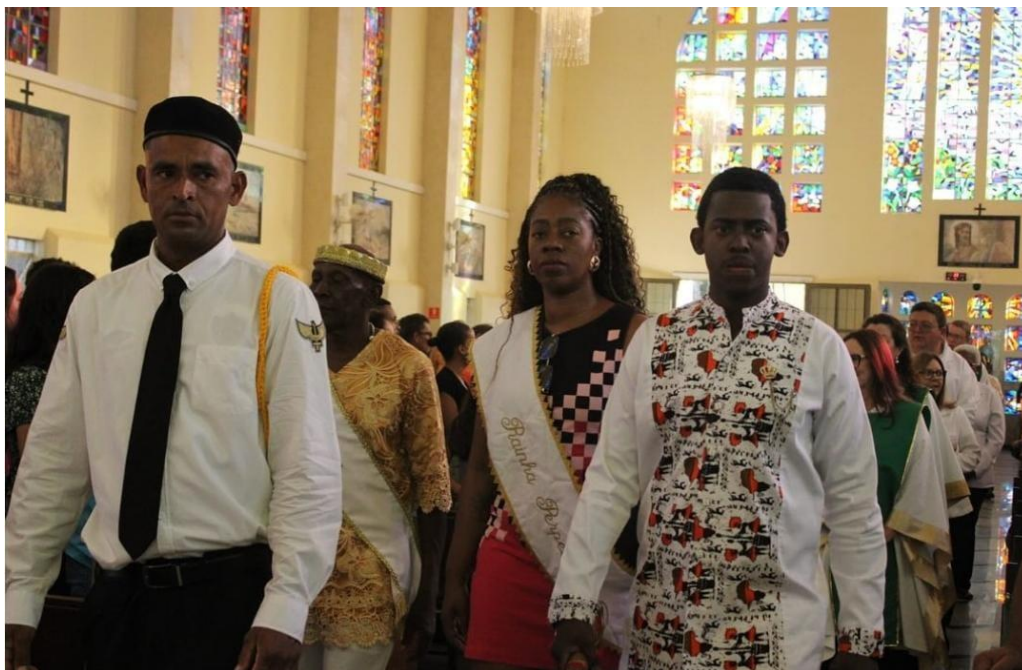
Figura 21 – Participação da Corte do Rei na Santa Missa em louvor a São Benedito, Santa Efigênia e Nossa Senhora do Rosário.