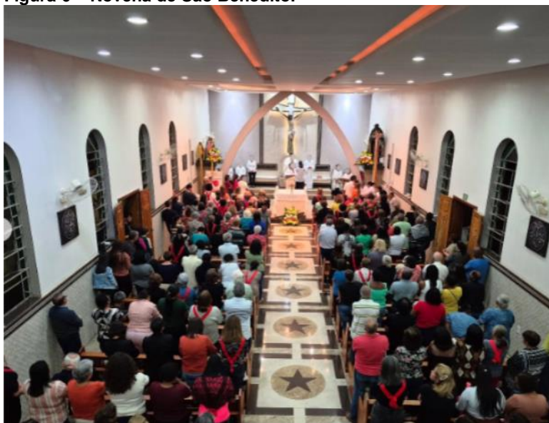
Figura 6 – Novena de São Benedito.