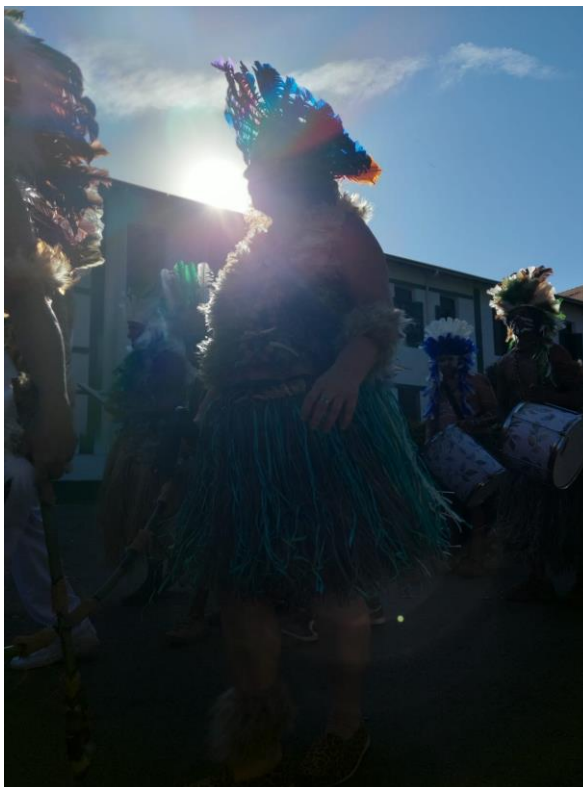
Figura 18 – Caiapós, Festa de São Benedito.