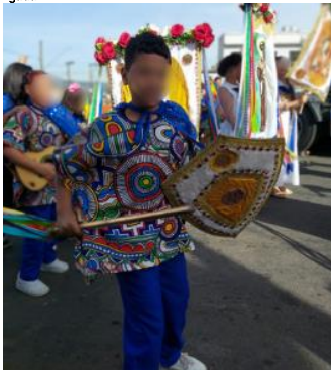
Figura 14 – Terno de Congada Mirim.

e fortalecendo a presença das crianças na preservação e valorização da cultura afro-brasileira local.