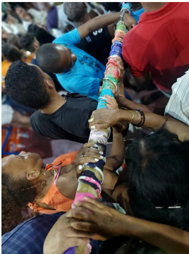
Figura 27 – Descida do Mastro.