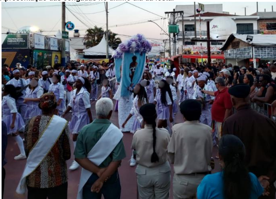
Figura 25 – Apresentação das congadas no último dia da festa.

No último dia da festa, feriado no município, todos os ternos se apresentam na praça e recebem uma premiação em agradecimento pela participação. Após todos se apresentarem, é realizada a descida do Mastro e da Bandeira de São Benedito e, assim como na subida dos itens, novamente os ternos se dividem para levar os itens de devoção de volta à casa de seus capitães.