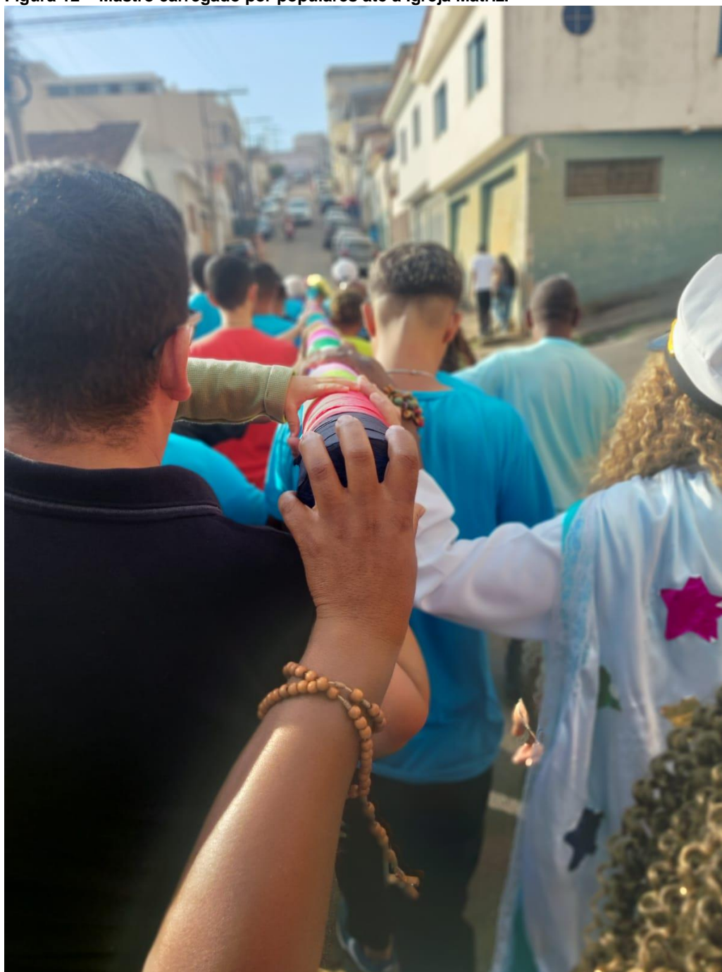
Figura 12 – Mastro carregado por populares até a Igreja Matriz.