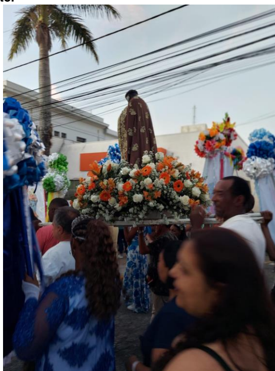
Figura 24 – Procissão de São Benedito.

Após a Missa, os andores com as imagens dos santos se misturam em meio às congadas e saem em procissão em direção à Praça de São Benedito. Essas imagens são sempre acompanhadas pela corte do rei perpétuo.