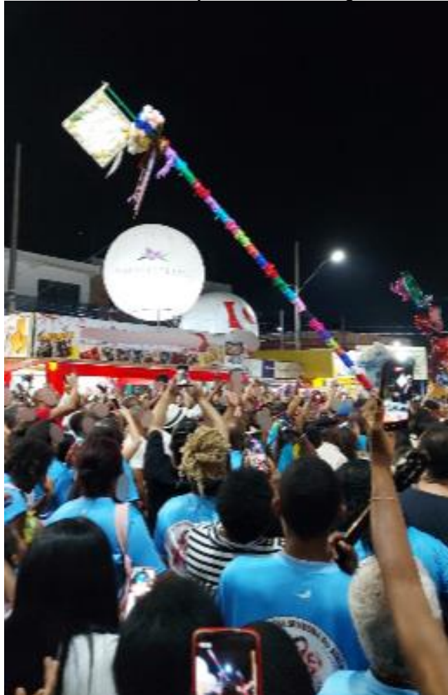
Figura 13 – Mastro e Bandeira sendo levantados pelas mãos de congadeiros e devotos.