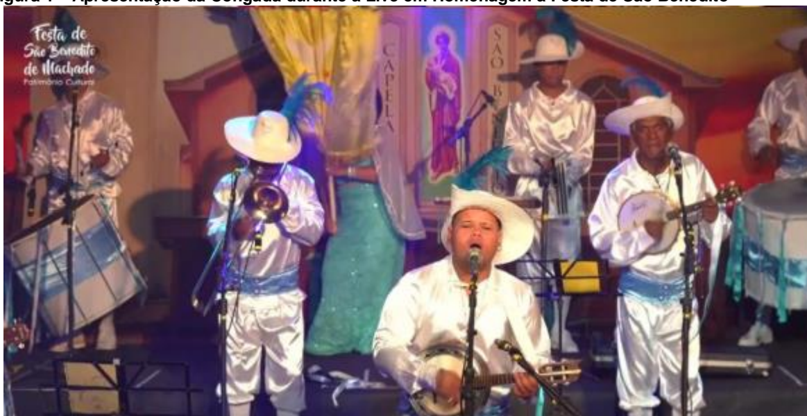
Figura 1 – Apresentação da Congada durante a Live em Homenagem à Festa de São Benedito 5