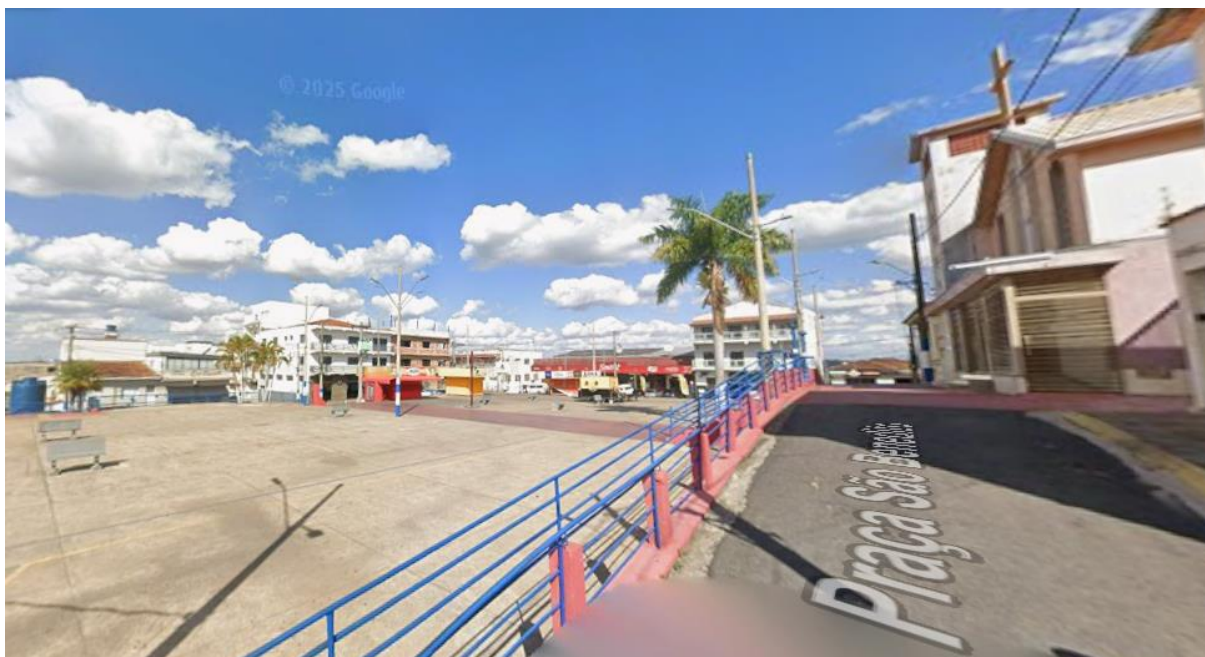
Figura 2 – Praça de São Benedito, Machado-MG

3