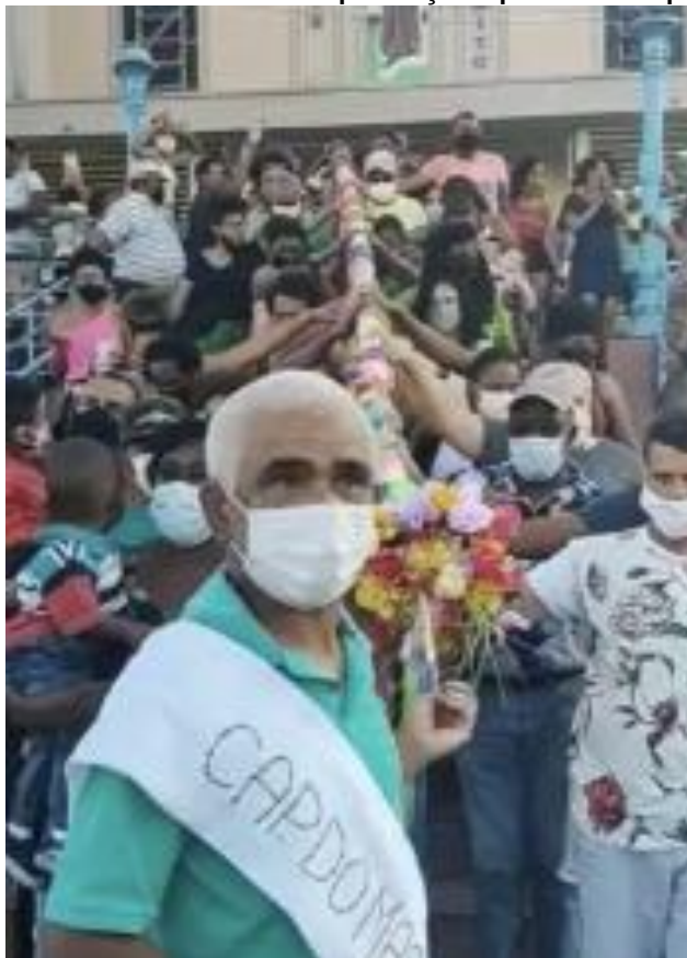
Figura 2– Subida do Mastro de São Benedito com a presença de público e adaptações sanitárias 6