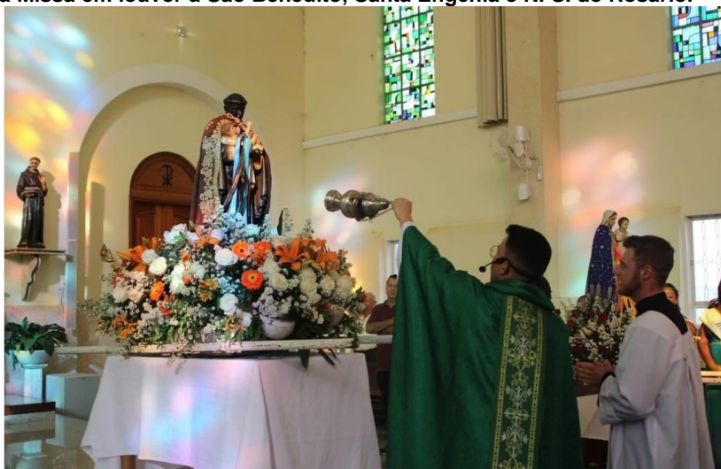
Figura 22 – Santa Missa em louvor à São Benedito, Santa Efigênia e N. S. do Rosário.