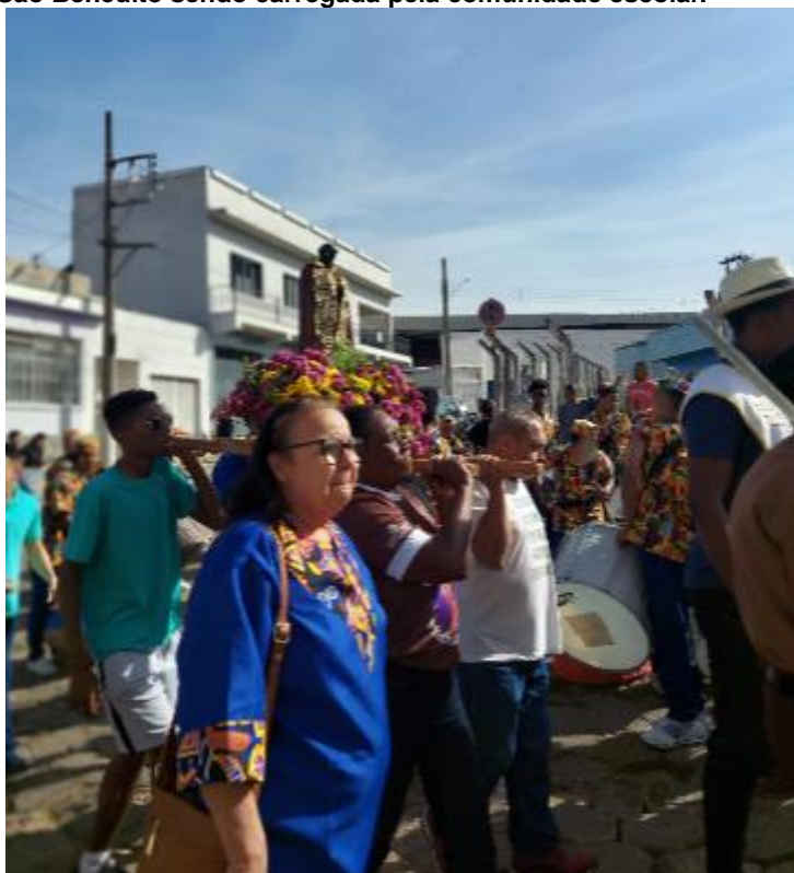
Figura 15 – Imagem de São Benedito sendo carregada pela comunidade escolar.