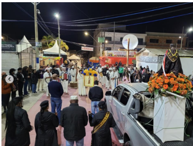
Figura 4– Alvorada da Festa de São Benedito, com participação do terno de congada.