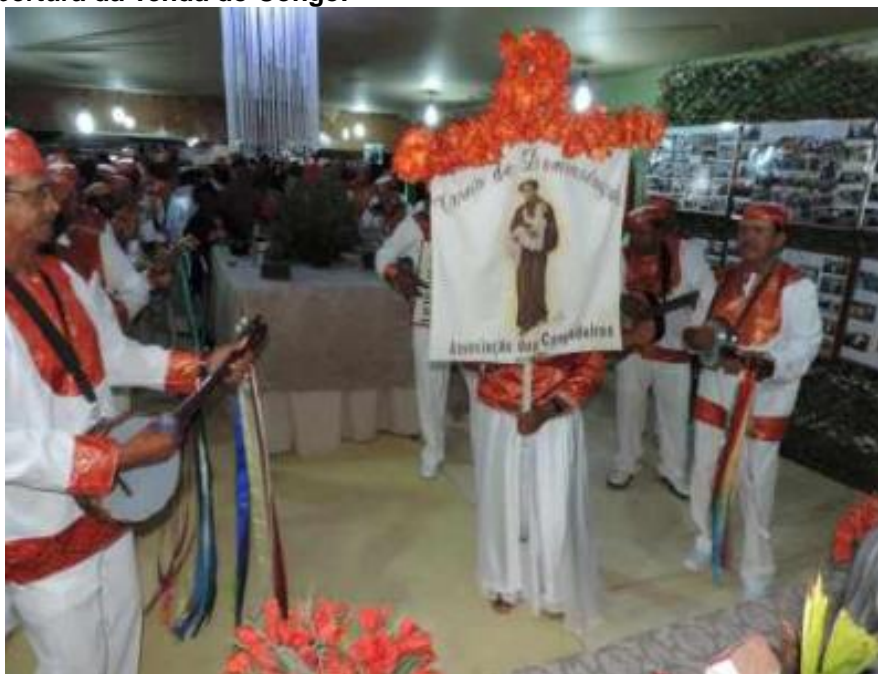
Figura 7 – Abertura da Tenda do Congo.