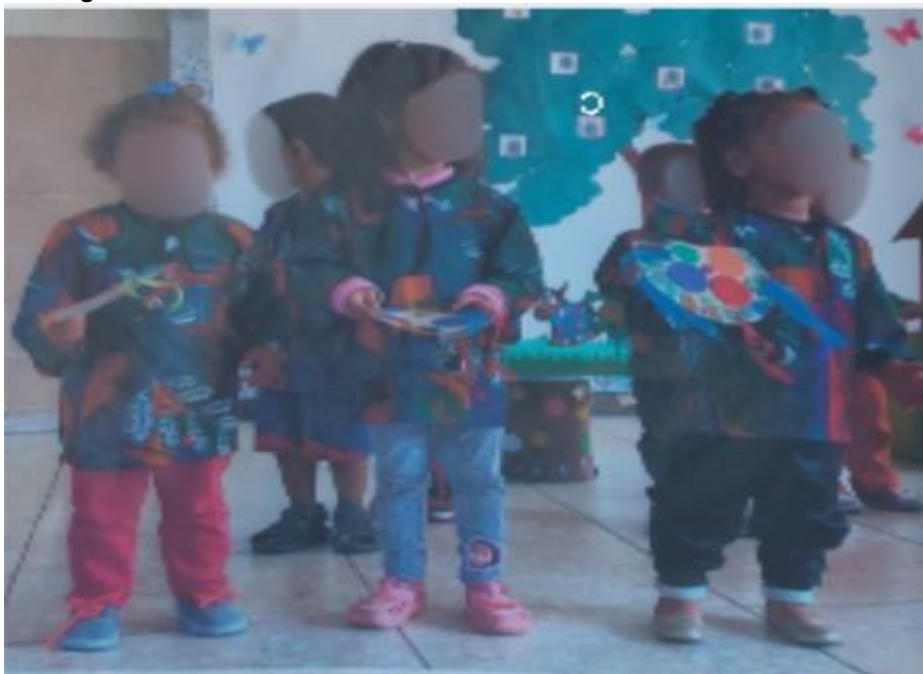
Figura 30 – Os Amigos do Folclore.