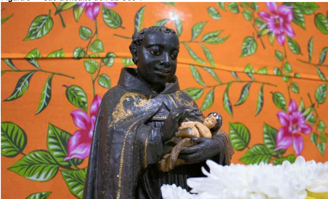
Figura 9 – “São Benedito do Pau Oco”.