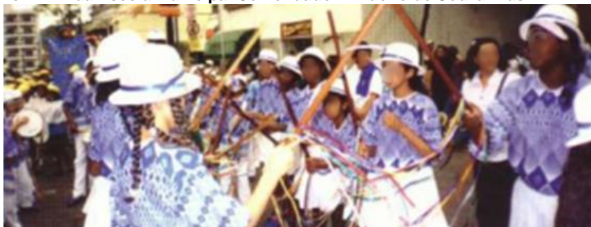
Figura 33 – Terno Mirim da Escola Municipal Comendador Lindolfo de Souza Dias.