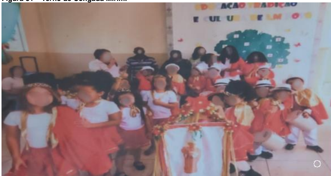
Figura 31 – Terno de Congada Mirim.