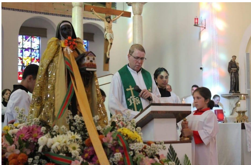
Figura 23 – Santa Missa em louvor à São Benedito, Santa Efigênia e N. S. do Rosário.

Fonte: Instagram da Paróquia Sagrada Família e Santo Antônio (@psfsamachado), 2025.