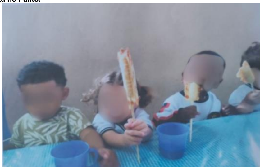
Figura 28 – Pizza no Palito.