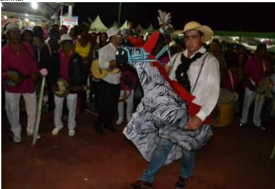
Figura 17 – Mulinha.