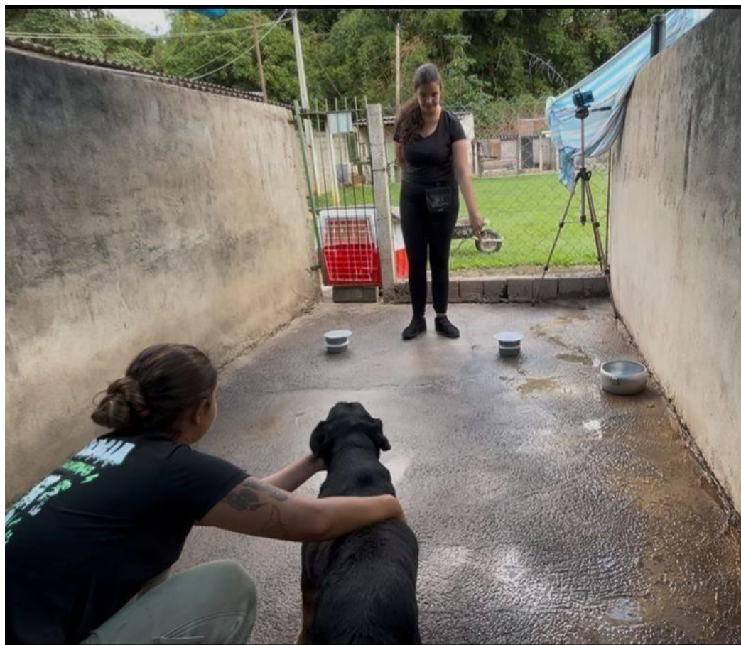
Figura 4 - Teste de apontar de um cão não-familiar