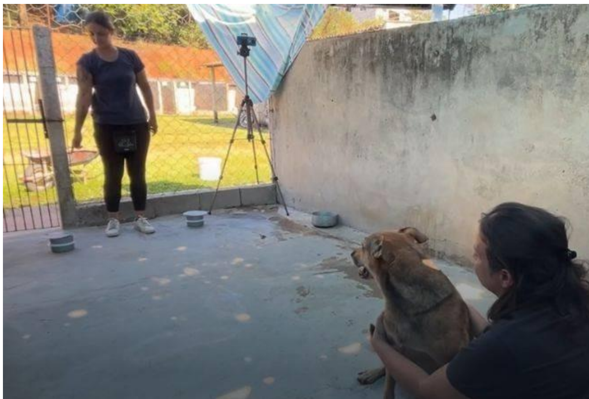
Figura 3 - Teste de apontar de um cão familiar