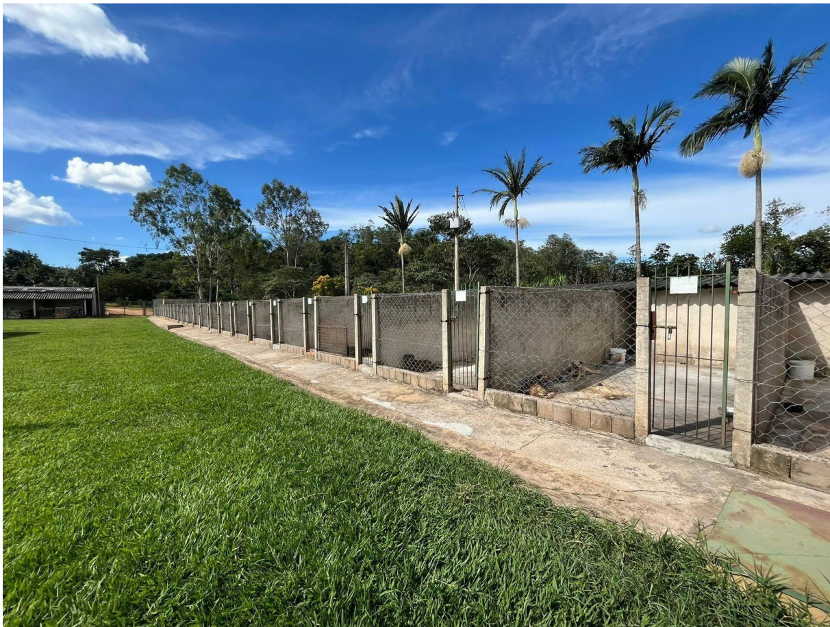
Figura 2 - Baías onde os cães eram alojados no canil ASOPAMA.