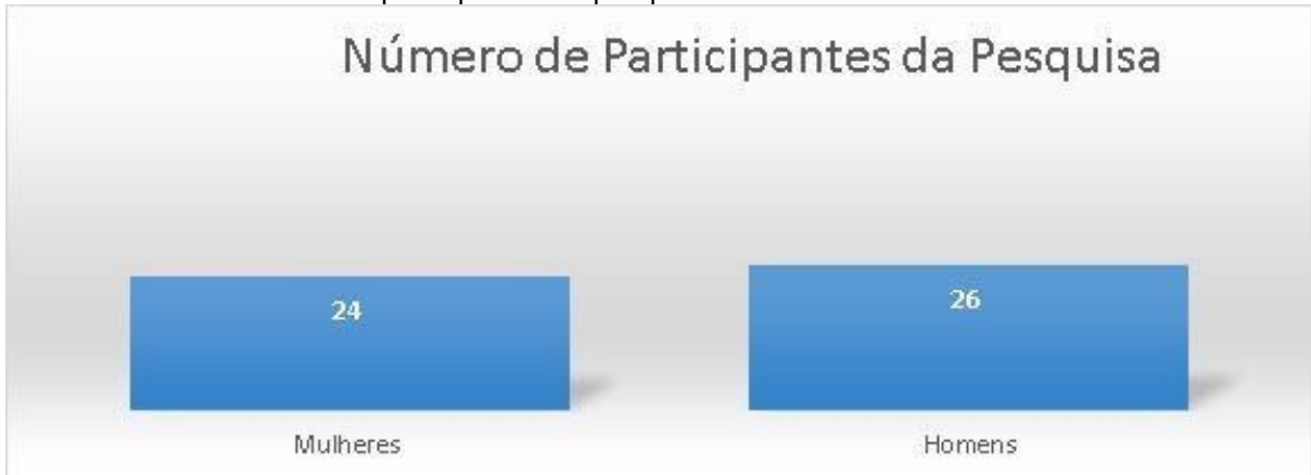
Gráfico 01 - Número total de participantes da pesquisa.