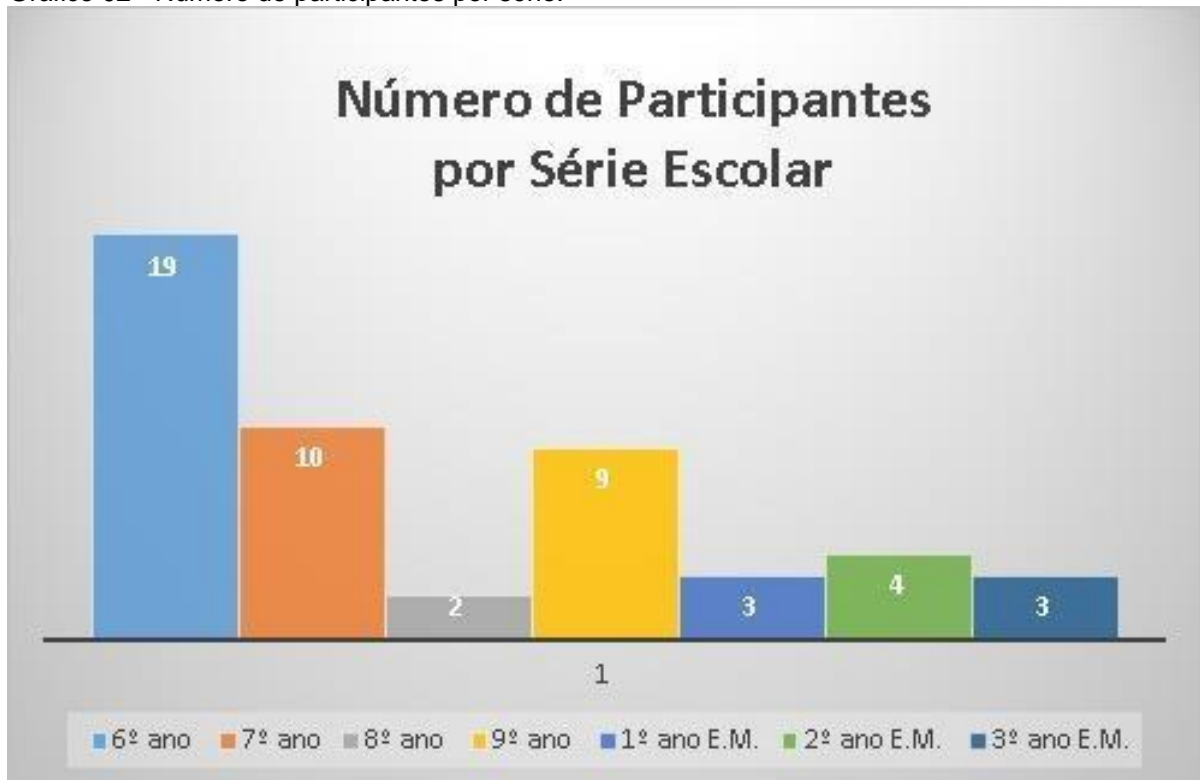
Gráfico 02 - Número de participantes por série.