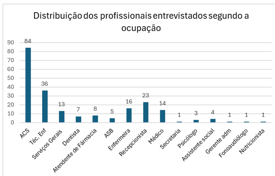
Gráfico 1: Distribuição dos profissionais entrevistados segundo a ocupação ( n=216 ). Alfenas, 2025.